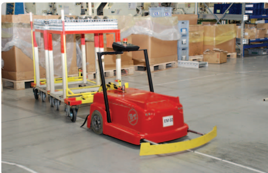
Automatický tahač BT Autotruck