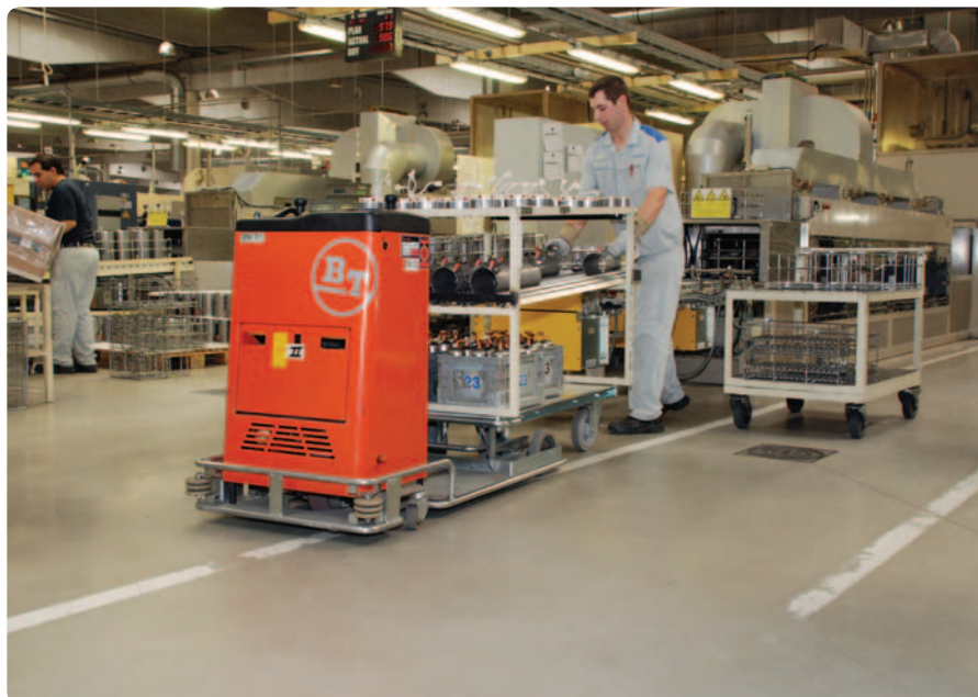
BT Movit zvyšuje výkon obsluhy