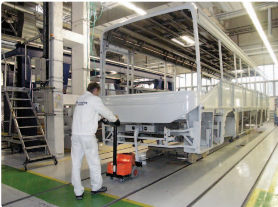
Tahač BT Unimover

další použití. Napojování a odpojování vozíků je snadné a rychlé, ale pevné, takže se nerozpojí ani při vyšších hmotnostech nákladu nebo při přejezdu nerovností. Hmotnost palety obvykle nepřesahuje 1 000 kg.