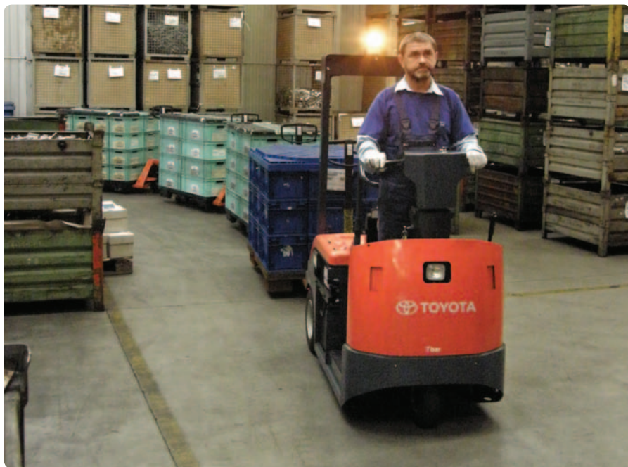
Tahač Toyota a vláček z paletových vozíků s nákladem

Tažné vozíky jsou nedílnou součástí řady výrobních linek a logistických operací, protože nabízejí vysoce efektivní a pohodlné řešení horizontálního transportu, zejména na dlouhé vzdálenosti. V mnoha případech výrazně zkracují přepravní časy, a tím zvyšují produktivitu práce ve srovnání s jinou manipulační technikou.