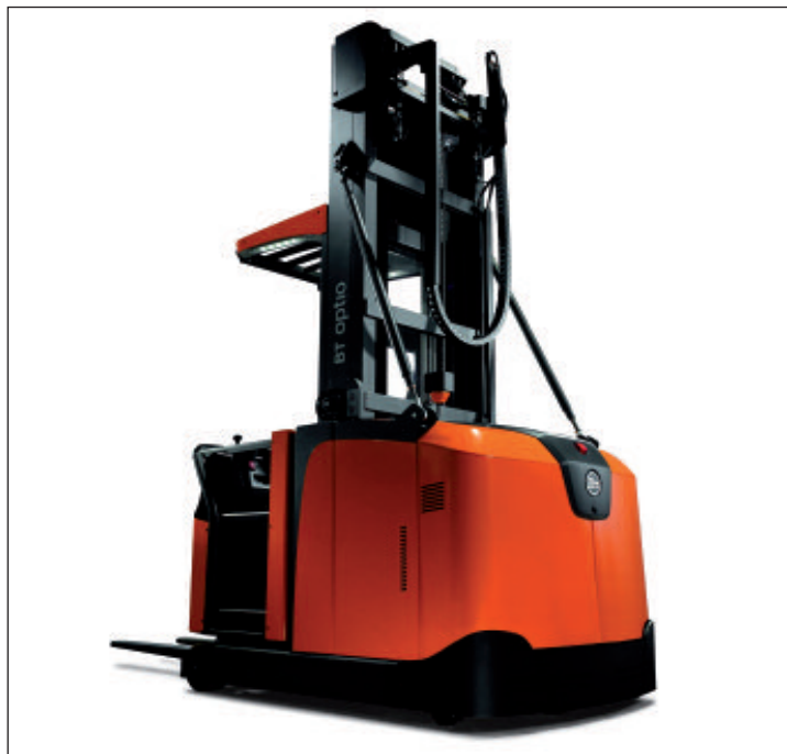
Jedna z aktuálních novinek v portfoliu společnosti Toyota Material Handling. Vozík BT Optio pro vychystávání ve výšce až 12 m.

Nejvyšší prioritou společnosti TMH CZ je oblast servisních služeb. Nabízí různé varianty servisních programů a servisních smluv šitých na míru různým typům provozů i různé frekvence nasazení jednotlivých typů vozíků. Celá ČR je pokryta hustou sítí mnoha desítek mobilních dílen umožňujících provádět rychlý lokální servis bez dlouhých dojezdových vzdáleností a bez čekání na náhradní díly. Součástí nabídky jsou i pravidelné povinné roční technické prohlídky, generální opravy, nabídka příslušenství ke všem typům vozíků včetně baterií, pneumatik, přídatného zařízení a další služby. (lh) □