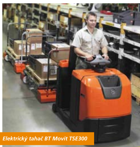
Elektrický tahač BT Movit TSE300