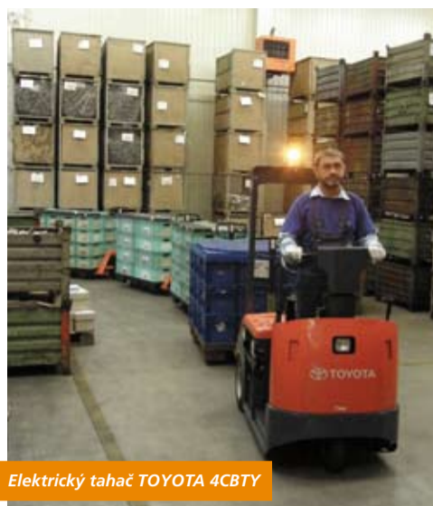
Elektrický tahač TOYOTA 4CBTY

Dlouhou provozní dobu vozíku zajišťují baterie o kapacitě až 620 Ah. Baterie vydrží přibližně směnu a půl - v závislosti na počtu napojených vagonků, na průměrné hmotnosti nákladů a vytíženosti vozíků během pracovního dne. Pro snadnou a rychlou výměnu baterie je možné přiojednat výměnné stoly a rolny.