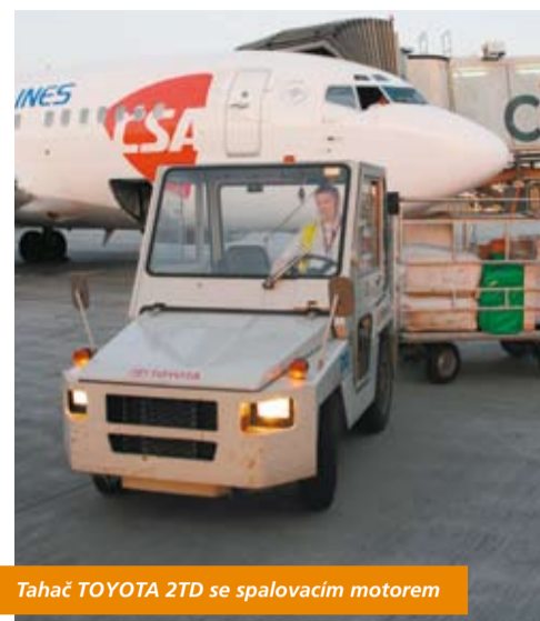
Tahač TOYOTA 2TD se spalovacím motorem