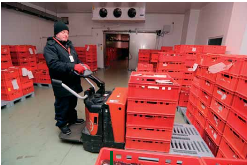
Vozíky BT pracují spolehlivě v chladiřenském skladu i se standardní výbavou