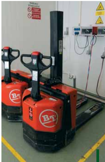
Vozíky jsou dobíjeny na vyhrazeném a jasně označeném místě

"Základ tvoří nejmodernější retrak RR B2 s výškou zdvihu 4800 mm fungující v centrálním skladu hotových výrobků, výkonné elektrické ručně vedené vysokozdvíhací vozíky s jednosloupovým centrálně umístěným stožárem SWE080L a nízkozdvíhací vozíky LWE180 nebo LPE200 vybavené sklopnou stupačkou pro rychlejší a pohodlnější práci. Oba typy, využívané pro identický druh práce se liší svojí výbavou, robustností a velikostí bateriového prostoru. LPE200 s baterií až 24/300 Ah je tak vhodný pro delší pojezdy i pro frekventovanější nasazení po dobu dvou směn na jedno nabití baterie," dodává Ivana Brabcová.