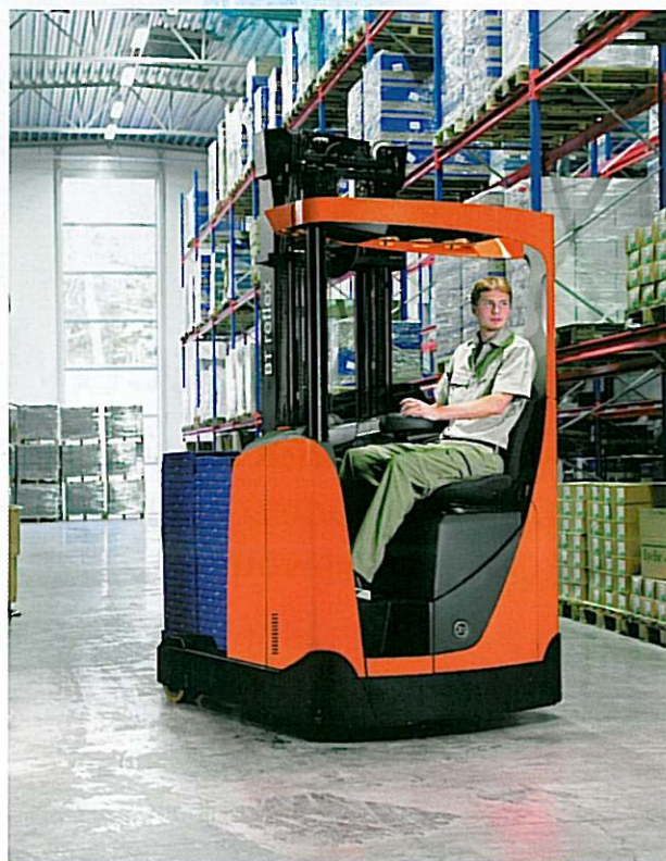
Nová Toyota BT Reflex

Retraky BT Reflex definují nová kritéria konstrukce inteligentních retraků, počínaje silnými a účinnými motory na střídavý proud, zajišťujícími bezpečný a vysoce produktivní provoz, až po vyspělou elektroniku s možností programování jednotlivých výkonových parametrů pomocí PIN kódu - podle provozních podmínek konkrétních aplikací či specifických požadavků a zkušeností řidiče. Nabídka pěti modelů řady BT Reflex s nosnostmi 1,4; 1,6; 1,8; 2 a 2,5 tuny zahrnuje dvě nové nosnostní kategorie - 1,4 a 1,8 tuny. Retraky BT Reflex jsou dodávány v provedení s exkluzivní naklápěcí kabinou nabízející lepší ergonomické parametry a lze je rovněž objednat v úpravě pro mrazírenské provozy nebo pro použití v úzkých vjezdových regálech.