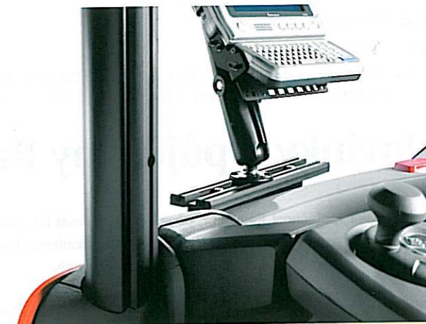
Vodorovná montážní lišta E-bar

Retraky řady BT Reflex byly zkonstruovány pro dlouhodobé používání. Všechny modely vyrobené v rámci výrobního systému Toyoty (TPS) jsou zárukou trvale vysokého standardu kvality a spolehlivosti. Součástí jejich výbavy jsou pohonné jednotky a převodovky určené pro velké zatížení a s prodlouženou životností i v těch nejnáročnějších provozech. Méně součástí, zato té nejvyšší technické úrovně - jako například bezkartáčkové motory či zcela nepropustné hydraulické přípojky - umožňuje delší nasazení vozíků a vyšší odolnost v tvrdých a náročných podmínkách. Prodloužené servisní intervaly, palubní diagnostika k rychlé identifikaci a odstraňování poruch a snadný servisní