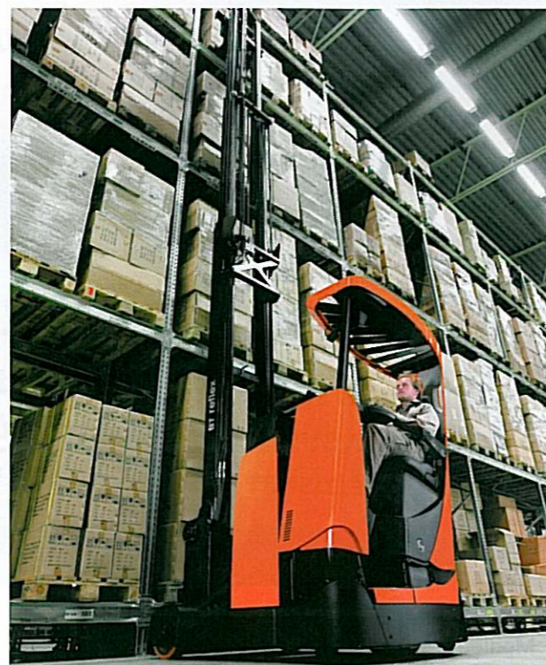
Vějířovitý zkosený ochranný rám řidiče umožňuje dobrou viditelnost směrem vzhůru

Nové modely řady BT Reflex využívají vyspělé motory na střídavý proud, zajišťující vysokou rychlost zdvihu a spouštění,